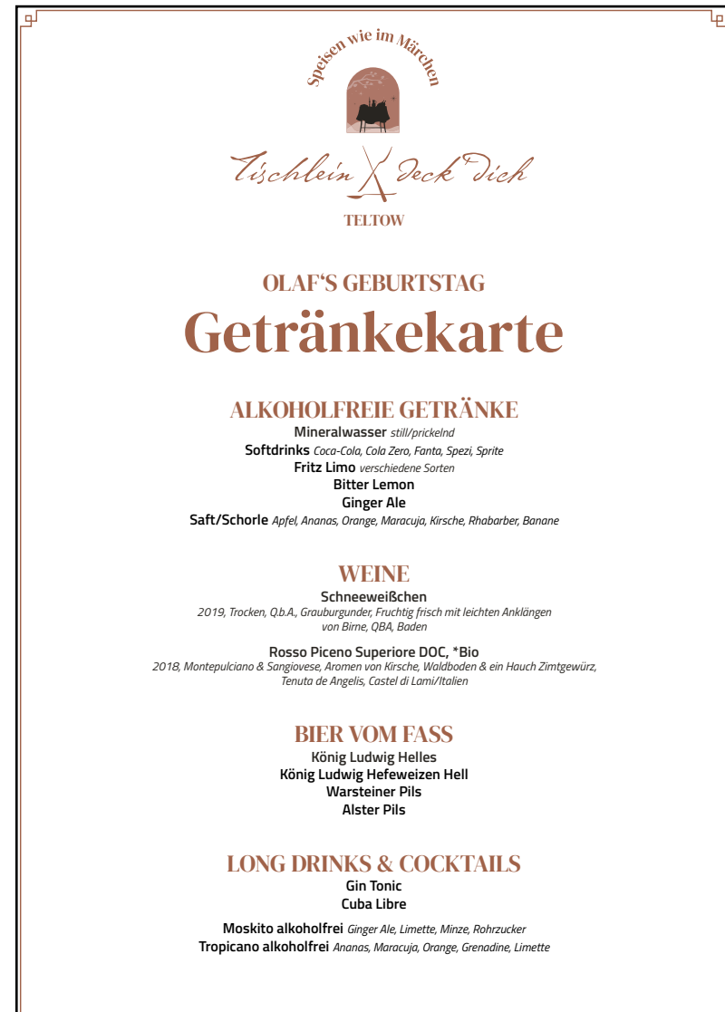
Beispiel kleine Getränkekarte